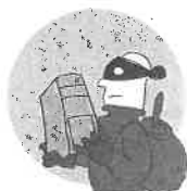
Kradzież z włamaniem